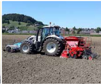
Säarbeiten mit Section Control und Variable Rate Control.