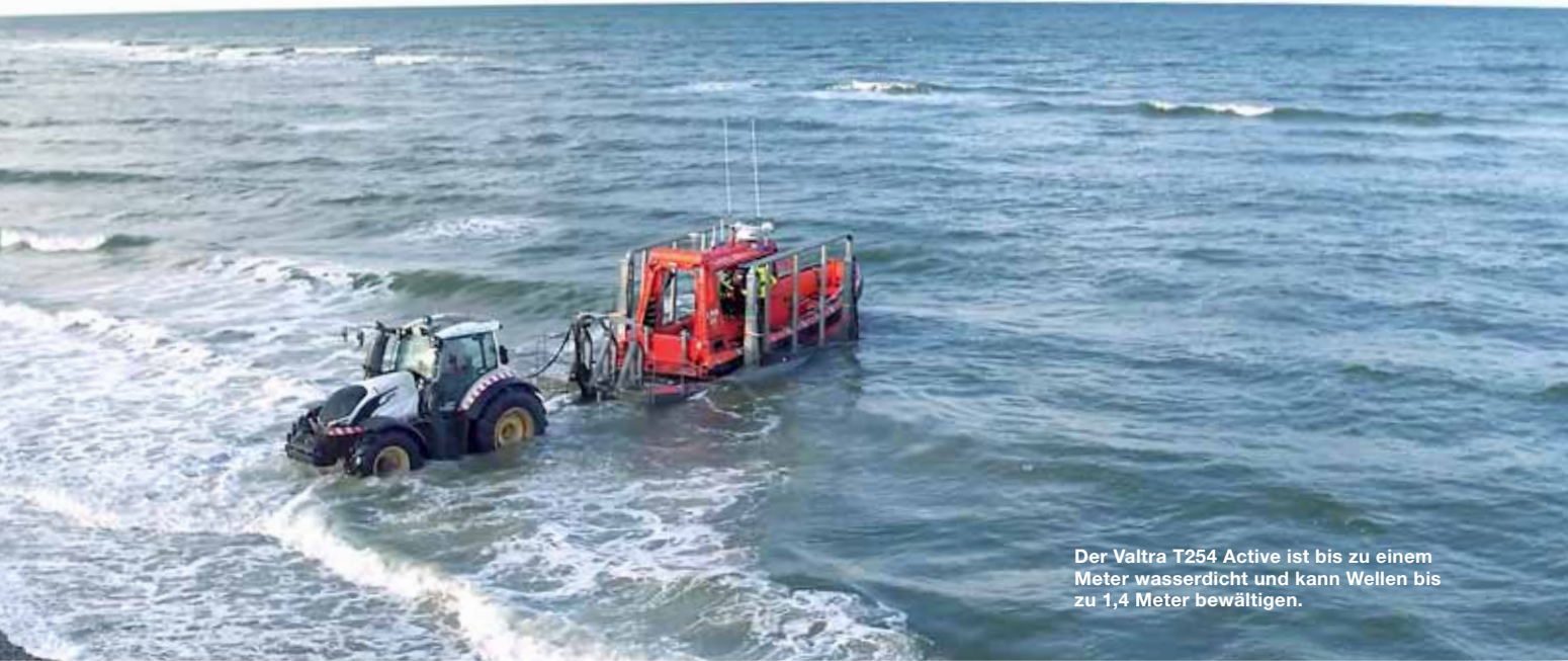
Der Valtra T254 Active ist bis zu einem Meter wasserdicht und kann Wellen bis zu 1,4 Meter bewältigen.