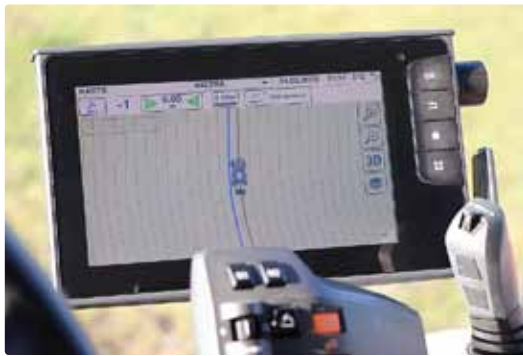
Über TaskDoc wird der Auftrag dem Fahrer übermittelt.