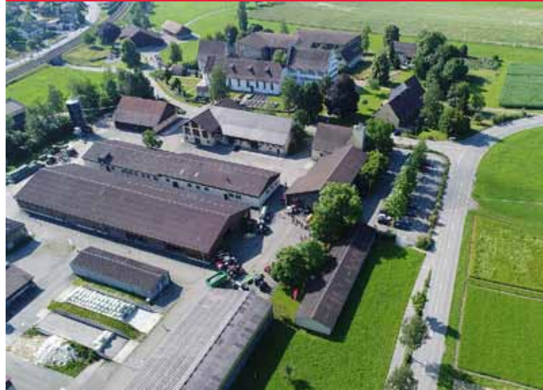
Die Swiss Future Farm in Tänikon (CH).

Nach jedem Arbeitsgang und sobald ein Auftrag abgeschlossen ist, werden die Daten via Task Doc vom Traktor an das FMIS zurückgesendet. Die manuelle Dokumentation fällt weg und der Betriebsleiter verfügt immer über aktuelle Daten, die er wiederverwenden kann. Denn nächste Jahr kommt bestimmt! •