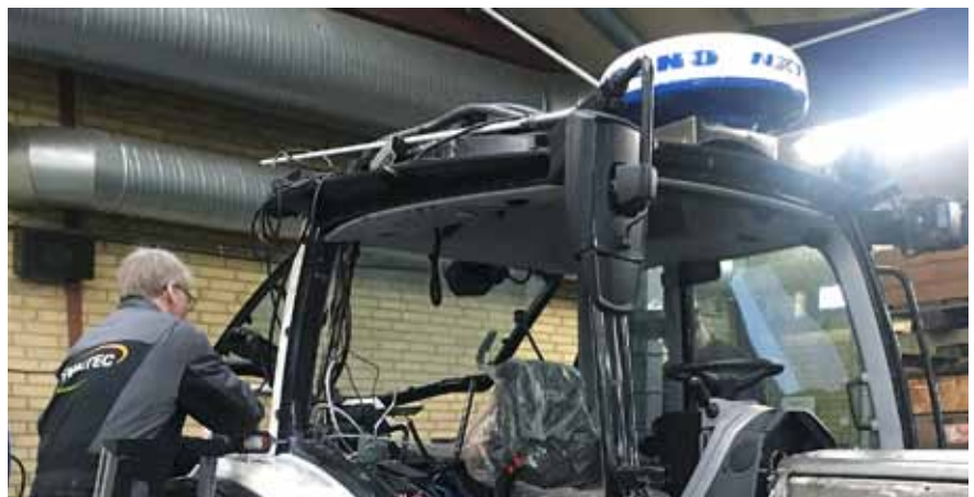
Die Valtra N154 ist ein Mehrzweckfahrzeug, das mit einer Vielzahl an Geräten ausgestattet werden kann, darunter ein Schiffsradar, eine Infrarot-Wärmesuchkamera und ein Suchscheinwerfer.

„Wir haben dieses Modell aufgrund der Kombination aus Gewicht und Leistung gewählt. Unsere Mindestanforderung beträgt 250 PS. Und ein Traktor wie der Valtra T254A mit all seiner modernen Technologie war perfekt für die schweren Aufgaben und dennoch stabil im losen Sand, der das Fahren äußerst schwierig macht.“, sagt Enok.