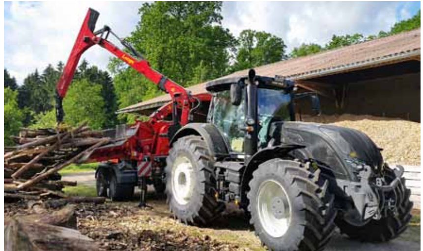
Valtra S394 beim Zerkleinern von Stammholz.