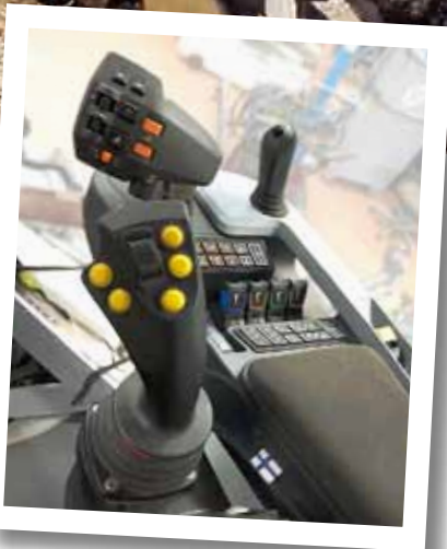
Bedienung des Hackers über Joystick.

und mit den Joysticks des Hackers kombiniert. Die Bedienelemente sind fest ins Fahrerhaus eingebaut.