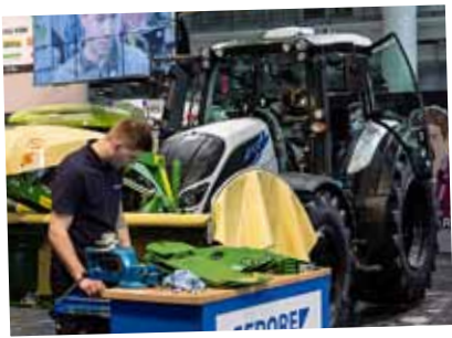
Valtra N174 auf der Werkstatt Live.