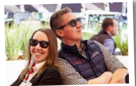
Valtra Sonnenbrillen zum „Mehr Sehen“.

cher konnten neben dem bekannten Produktsortiment auch den neuesten Zuwachs in der Valtra Familie bestaunen: die F-Serie. Auf der Werkstatt Live demonstrierten Nachwuchsmechaniker die Arbeit in der Werkstatt – unter anderem an einem Valtra N174. Wir danken allen Besuchern für ihr Kommen und freuen uns schon auf 2021. •