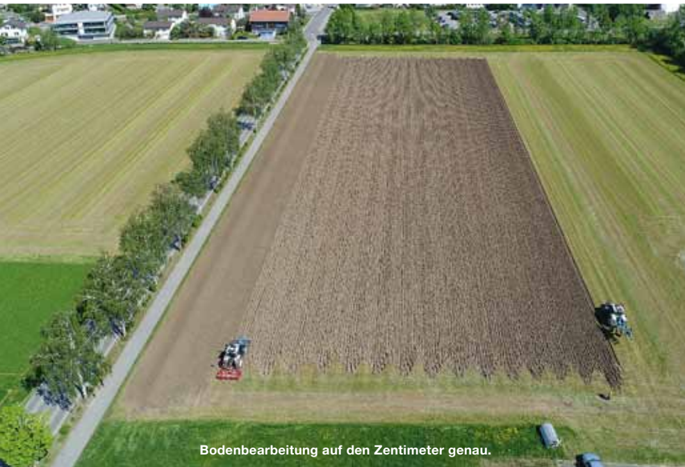
Bodenbearbeitung auf den Zentimeter genau.