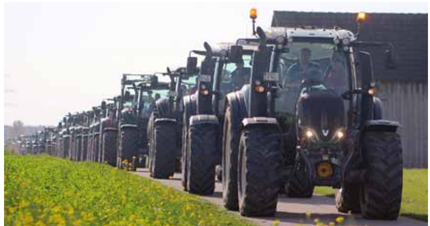
Valtra Traktoren auf der Fahrt zum Gruppenfoto.

Valtra Händler Mayer Landmaschinen stellte auf dem Werksgelände in Unterroth die neueste Landtechnik vor. Die Besucher informierten sich mit praxisnahen Probefahrten über den neuesten Stand der Traktorentechnik. Nach einem deftigen Mittagessen konnten alle Valtra Fahrer an einer Verlosung teilneh-