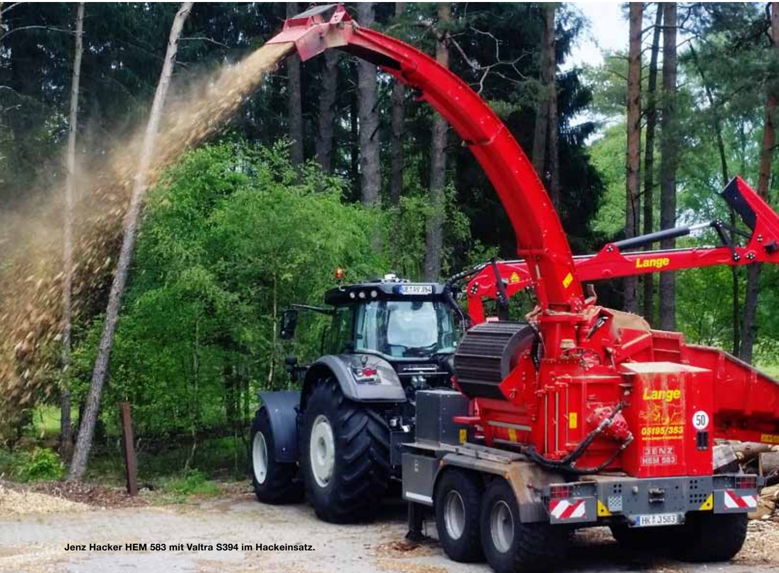
Jenz Hacker HEM 583 mit Valtra S394 im Hackeinsatz.

TEXT AILEEN ULRICH