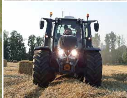
Ernte auf der Swiss Future Farm.