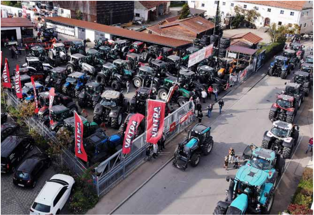
Treffpunkt von über 70 Valtra Traktoren auf dem Werksgelände von Mayer Landmaschinen.

A m 27. Oktober 2019 veranstaltete das Valtra Team Unterroth das siebte Traktortreffen des finnischen Traktorenherstellers Valtra. Bei dieser deutschlandweit einzigartigen Veranstaltung nahmen rund 70 Ackergiganten mit einer Gesamtleistung von über 10.000 PS teil.