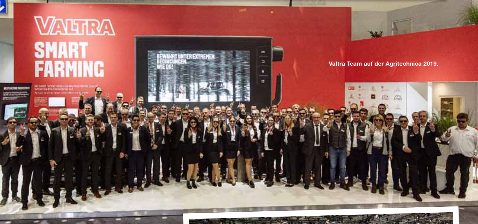
Valtra Team auf der Agritechnica 2019.